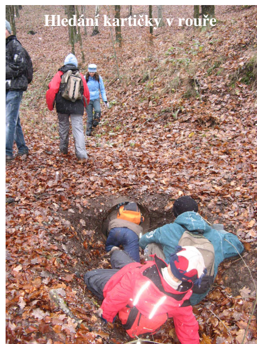
Hledání kartičky v rouři